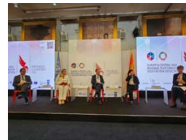
Crveni krst na Evropskoj i Centralnoazijskoj regionalnoj platformi za smanjenje rizika od katastrofa