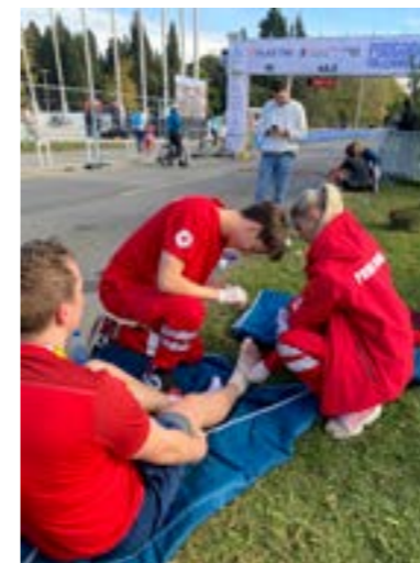
Tim Crvenog krsta za pružanje prve pomoći na obezbjeđivanju trke Millennium run