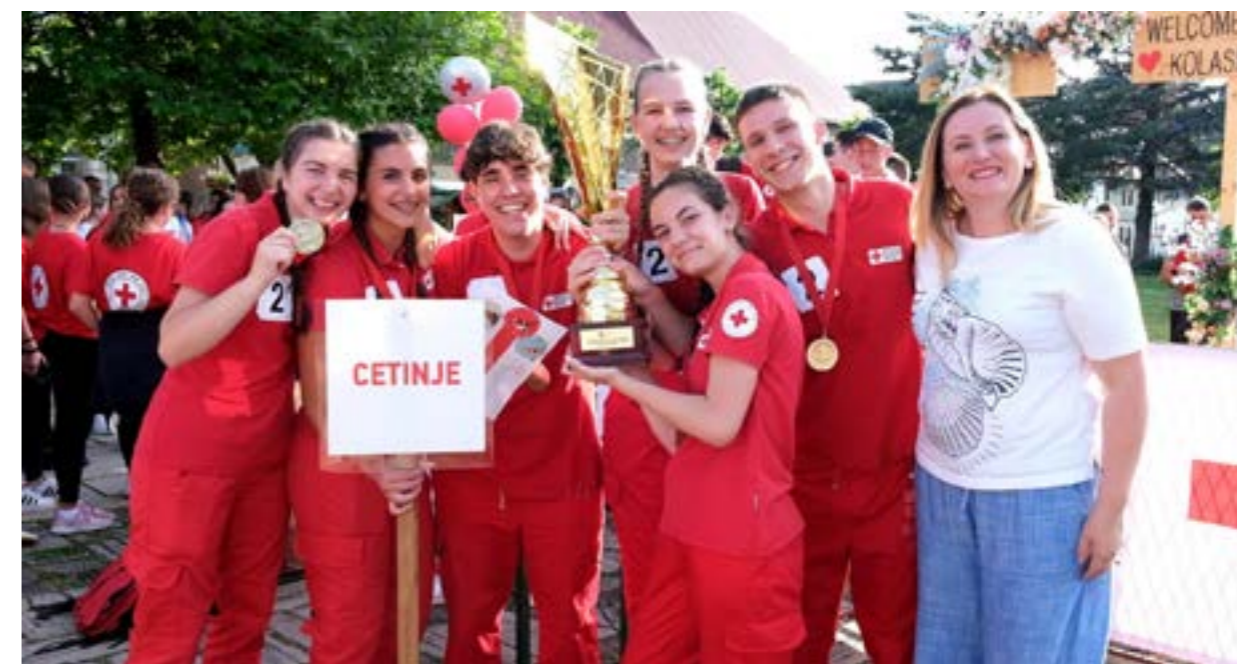
pobjednička ekipa OCKP Cetinje u kategoriji omladine