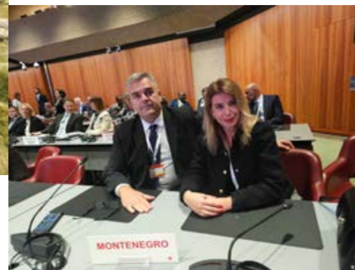
Delegacija Crvenog krsta na 34. Međunarodnoj konferenciji Crvenog krsta i Crvenog polumjeseca