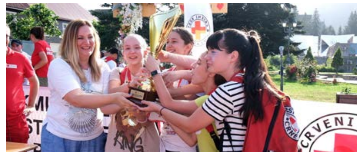
pobjednička ekipa OOCK Danilovgrad u kategoriji podmlatka