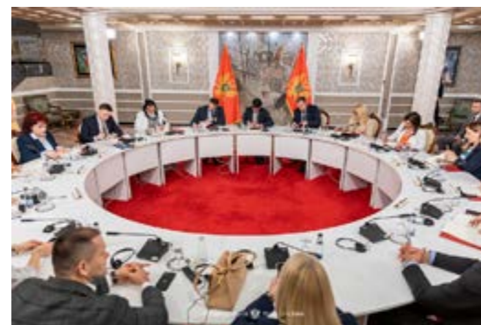
I Crveni krst potpisnik Sporazuma o međusobnoj saradnji u oblasti borbe protiv trgovine ljudima