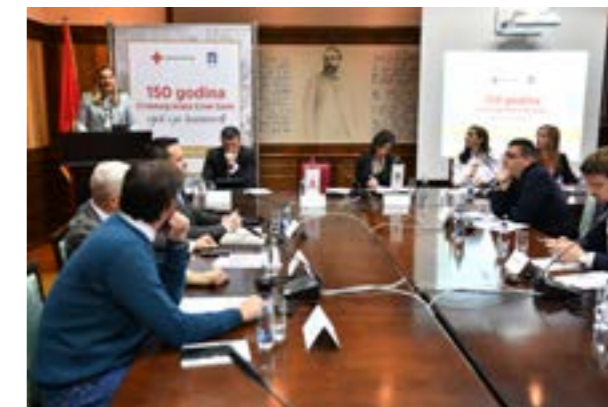
Okrugli sto na temu izrade monografije povodom 150 godina postojanja i djelovanja