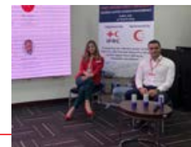
Dio tima Crvenog krsta za djelovanje u vanrednim situacijama na Međunarodnoj konferenciji za upravljanje lancem snabdijevanja